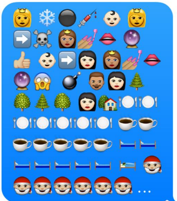
Den Inhalt anhand von Emojis nacherzählen: Schneewittchen